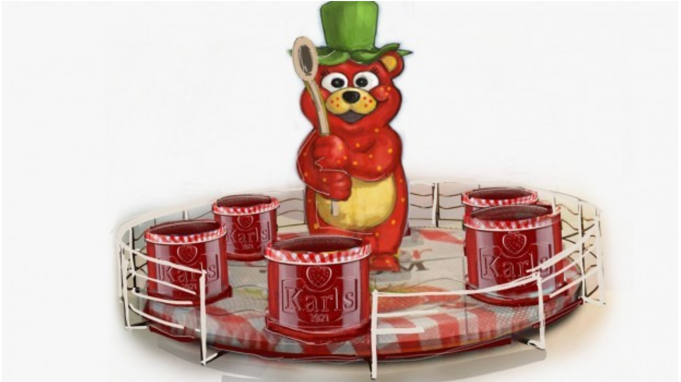
Fahrspaß in Marmeladen-Gläsern: Ein erster Vorgeschmack auf das neue Karussell.